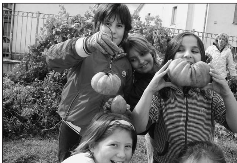
La raccolta dei frutti della terra.

Presso la mensa della scuola è stato cucinato un pasto favoloso, il cui sapore ha varcato i confini locali ed è stato apprezzato anche a Brescia, all'appuntamento con la manifestazione "Ambiente e dignità dell'uomo". Il tema dell'educazione alimentare e ambientale è anche stato il filo conduttore dello spettacolo di fine anno scolastico 2009\2010, che ha visto im-