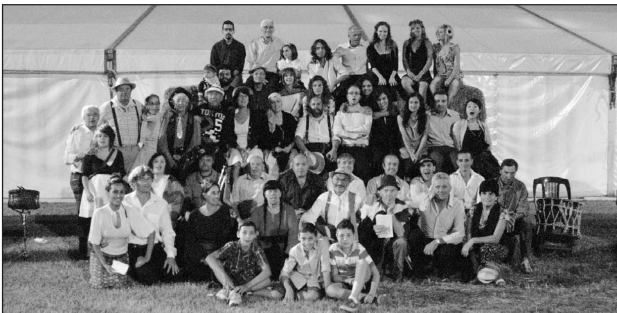
Foto ricordo dei partecipanti alla festa.

"Il canto della festa e del ricordo" - 27/28/30 agóst 2010