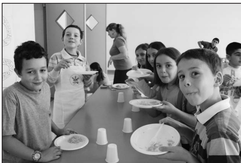
In mensa con i prodotti dell'orto.

La Cooperativa Sociale "La Sorgente" presenta