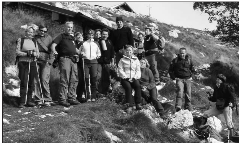
Vieni con noi ad osservare il mondo da un altro punto di vista.

La penultima escursione dell'anno si è tenuta la scorsa domenica con la partecipazione di un nutrito numero di appassionati della montagna, alla conquista della cima Pizzoccolo per la via delle roccette. Un sentiero che, lasciata la zona boschiva ricca di castagni, s'inerpica allo scoperto in panoramica veduta di Maderno e, oltre lo specchio lacustre, ferma la vista alle creste del Baldo. Ora la via è più ardua ma piacevole e si salta o ci si aggrappa alle cineree